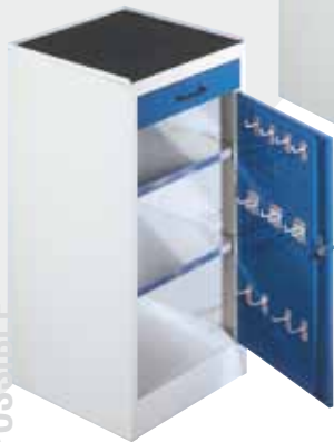
Modèle 1 Illustration avec tablette supplémentaire