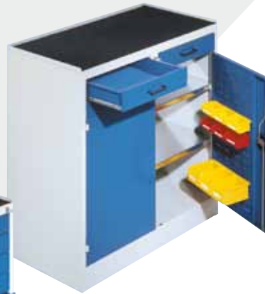
Modèle 4 Illustration avec tablette supplémentaire