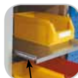
Tablettes coulissantes sur glissières télescopiques