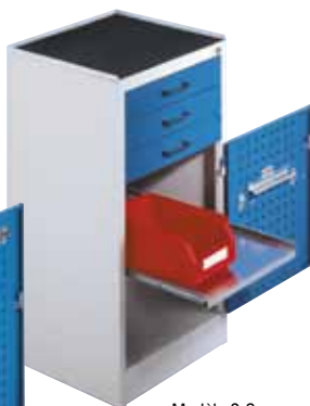
Modèle 2 S