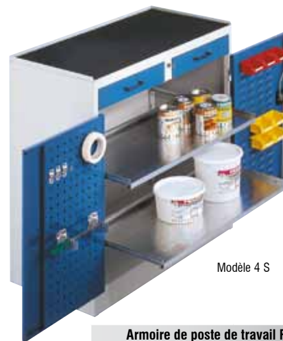
Modèle 4 S