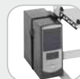
Support pour PC