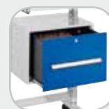
Tiroir pour dossiers suspendus