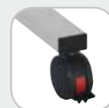
Roulette pivotante avec frein