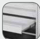
Tiroir individuel télescopique à sortie totale