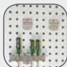
Porte intérieure avec panneaux à outils