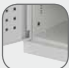
Porte fixée par une charnière à tige continue