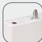
Tige de fermeture