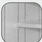
Réglage au pas des tablettes