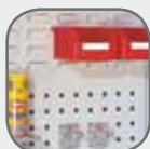
Panneaux à outils / panneaux à fentes