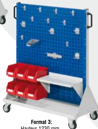
Format 3: Hauteur 1230 mm Équipement C