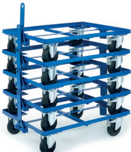
Timon + Attelage, Timon en acier plat d'épaisseur 5 mm, Longueur 280 mm, Attelage soudé sous le cadre, Flèche Ø 15 mm Référence.: 01ZD/583